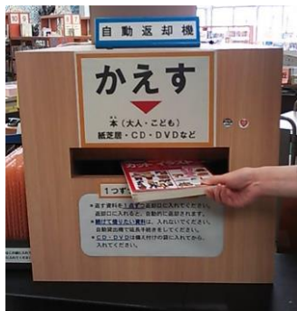
じどうへんきやくき 自動返却機

○ 借りたものは か 吹田市の すいたし どの図書館でも としょかん 返せます。