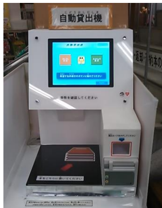
じどうかしだしき 自動貸出機