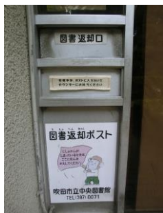
へんきやく ぼす と 返却 ポスト