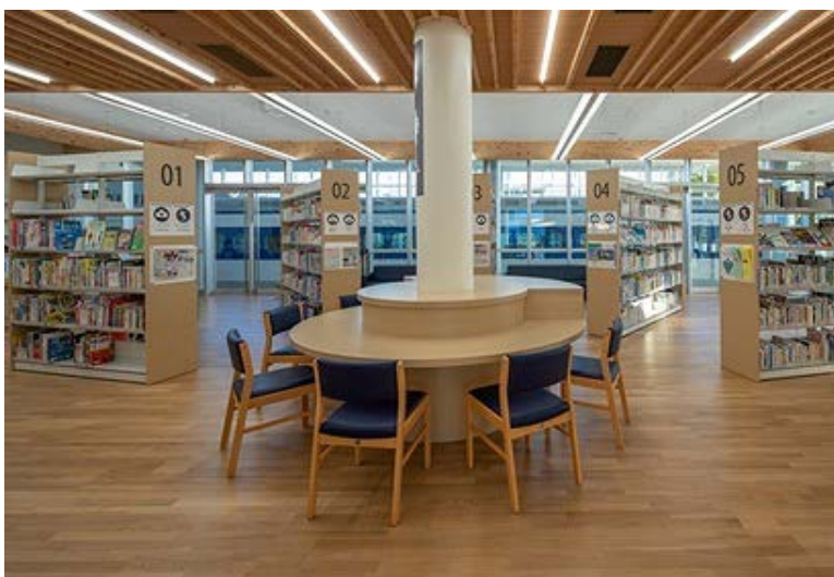
〔健康・医療・スポーツコーナー〕