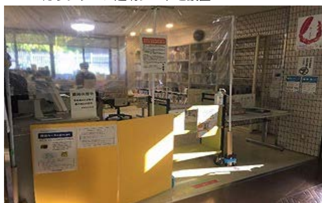
カウンターに透明シートを設置