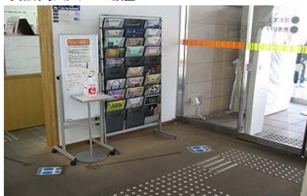
手指消毒スプレーの設置