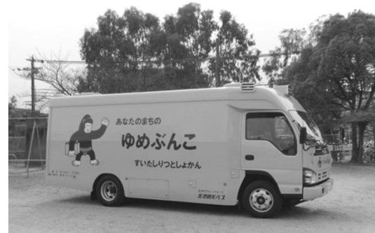
自動車文庫（愛称「ゆめぶんこ」）車両概要