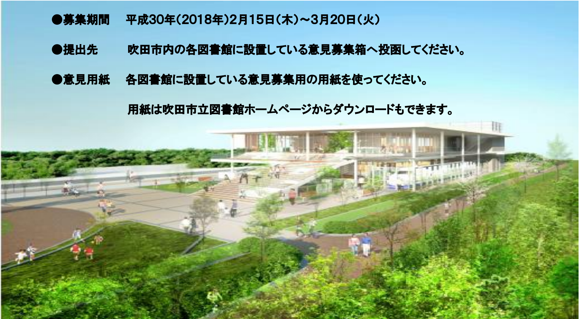
<イメージ図> ※イメージ図等は現時点のもので、設計者と本市の協議等において変更する場合があります。