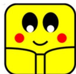
すいぼん