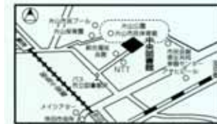
中央図書館 〒564-0272 室戸町18-9 ☎(06387)0071 FAX(06338)7144 ○阪急池田(豊津)駅徒歩10分 ○阪急バス市立図書館前下車