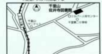
愛称(ちさと) 千歳山-佐井寺図書館 〒565-0843 千歳山和が丘25-2 ☎(0192)0516 FAX(0192)0517 ○阪急千歳山駅徒歩5分