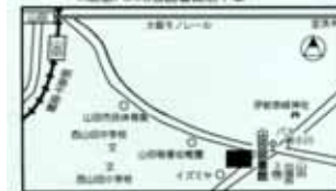
山田図書館 〒565-0824 山田町2-5-1 ☎(0675)1225 FAX(0675)1309 ○阪急山田駅より阪急バス(2)バス停徒歩 新小川下車