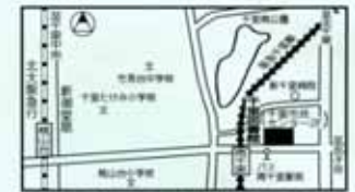
千里図書館 〒565-0962 津雲台1-1-02 ☎(06834)0132 FAX(06834)0560 ○阪急南千里駅徒歩1分 ○阪急バス南千里駅前下車