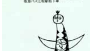
北千里分室 〒565-0814 北千里4-2-07 ☎(06834)2922 FAX(06834)2944 ○阪急北千里駅徒歩3分 ○阪急バス北千里駅前下車