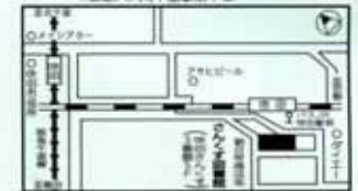
さんくす図書館 〒564-0027 朝日町3-501 ☎(0317)0037 FAX(0317)0258 ○JR東田駅まで ○阪急バス東田駅前下車