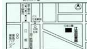
江坂図書館 〒564-0263 江坂町1-19-1 ☎(0385)3706 FAX(0385)3945 ○北大阪急行(地下鉄)江坂駅徒歩3分 阪急バス江坂駅前下車