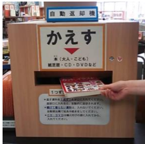
じどうへんきやくき 自動返却機

○ 借りたものは か 吹田市の すいたし どの としょかん 図書館でも かえ 返せます。