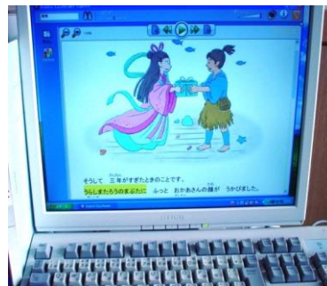
マルチメディアデジター

○ マルチメディアデジターを使えます。 (パソコンを使って文章を声で聞きながら、画面の文字を読むことができます。)