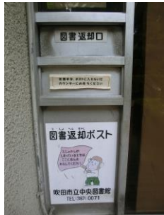
へんきやく ぼす と 返却ポスト

○ としょかん 図書館が し まっている とき ときは、 へんきやくぼ 返却ポストに す 入れて と ください。