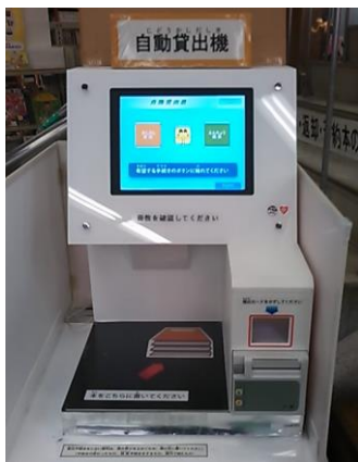
じどうかしだしき 自動貸出機

2. かりだし かーど と か 借りたいものを ようい じどうかしだしき か 用意し、自動貸出機で 借 ります。